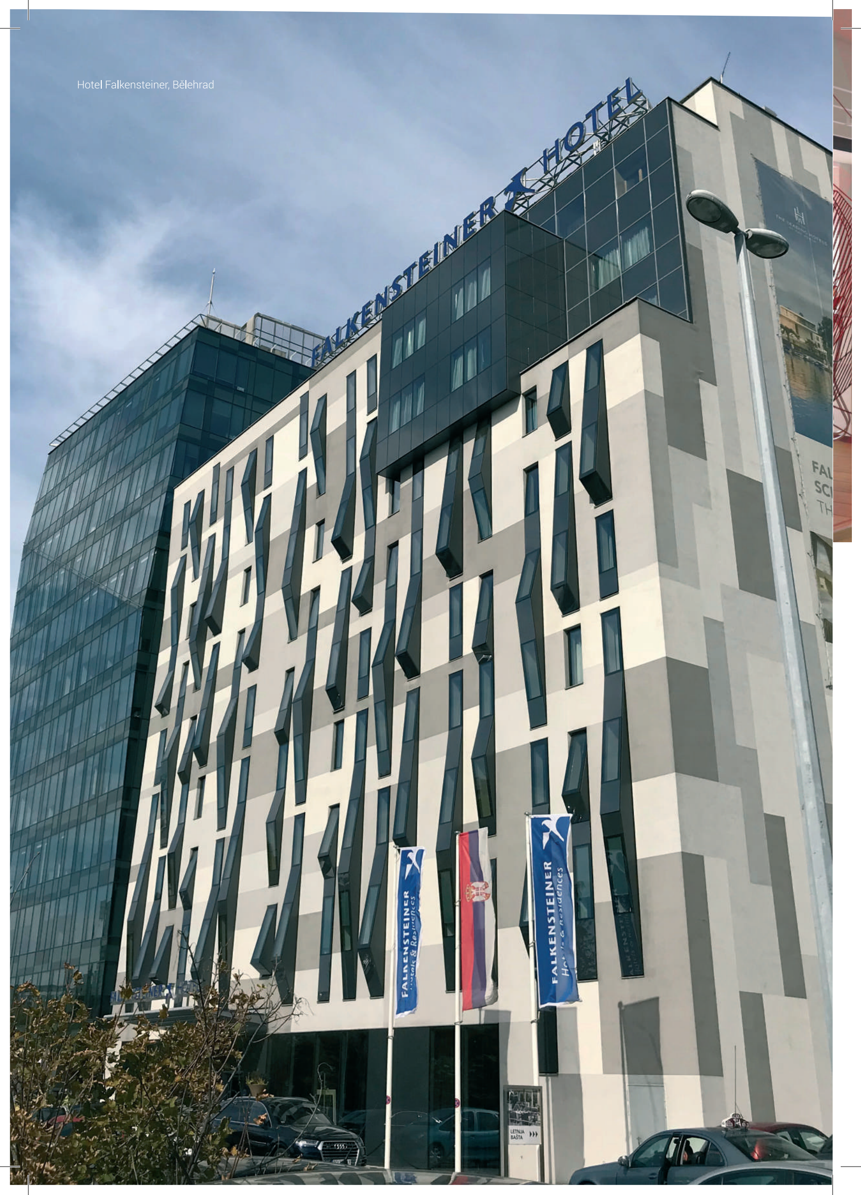
Hotel Falkensteiner, Bělehrad