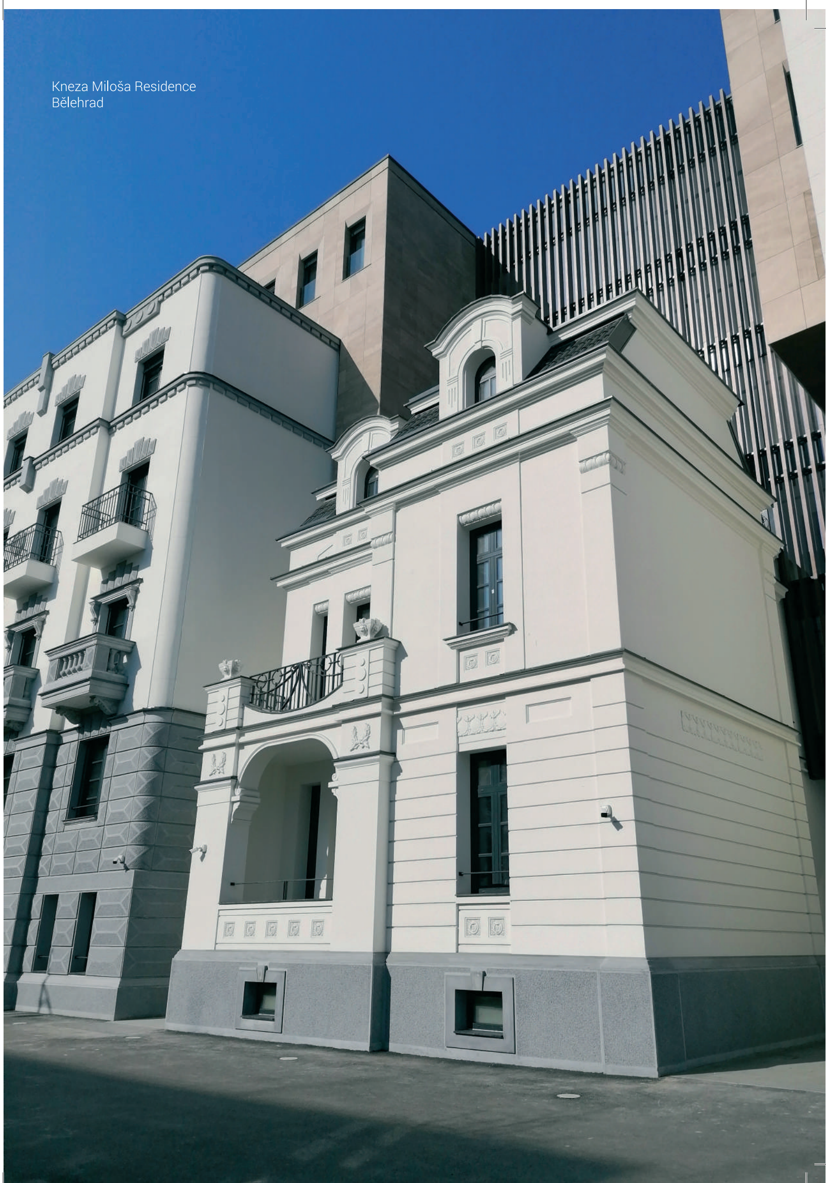
Kneza Miloša Residence Bělehrad